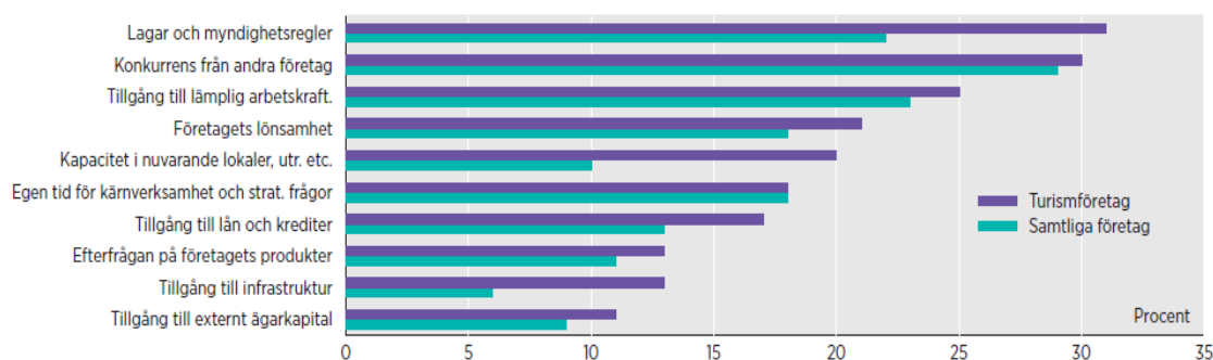
Figur 2.1.2. Andel företag som anser att olika faktorer är ett stort hinder för företags utveckling och hållbarhet. (Tillväxtverket 2016a)

Enligt Tillväxtverket rapport "Kompetensförsörjning och kompetensbehov" (2016) är hotell- och restaurangbranschen den bransch som förefaller ha störst kompetensbehov (se figur nedan) förefaller de närmaste åren. I rapporten uppskattas det årliga rekryteringsbehovet inom branschen mellan 2013–2023 uppgå till 40 000–50 000 personer. Nyexaminerade med relevant gymnasieutbildning uppskattas i samma rapport endast täcka en tiondel av den nationella efterfrågan.