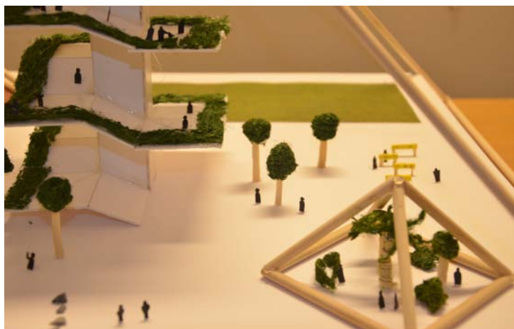
Trappan, med tropisk pyramid och biodlingar i bakgrunden