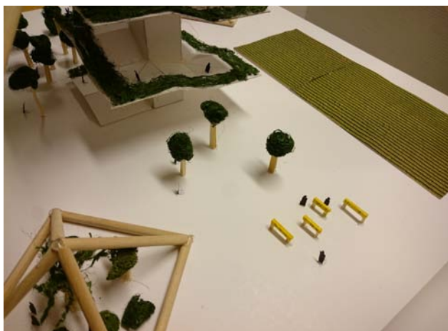
Tropisk pyramid samt biodlingar