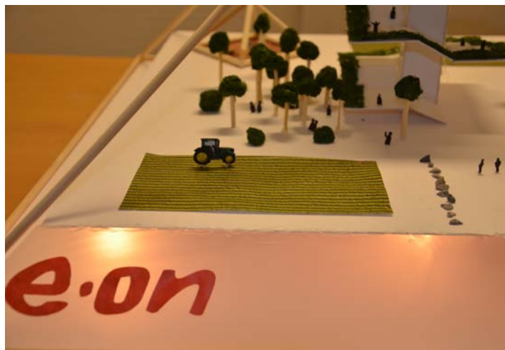
Odlingar ovanpå bottenplanets serverhall