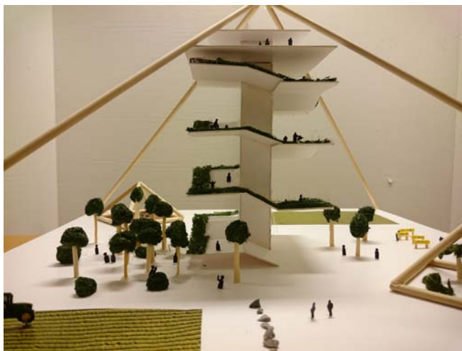
Odlingar samt Trappan