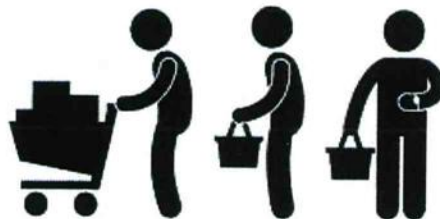
Figur 2. Svält är ett alltför reellt problem, men uppstår sällan i mataffärskön.

Vid processorschemaläggning och även vissa andra kontexter kan svält uppstå. Vad innebär det och hur kan det lösas? Se Figur 2 för inspiration.