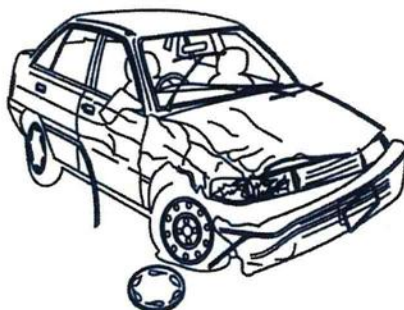
Figur 1. En bil som kraschat.