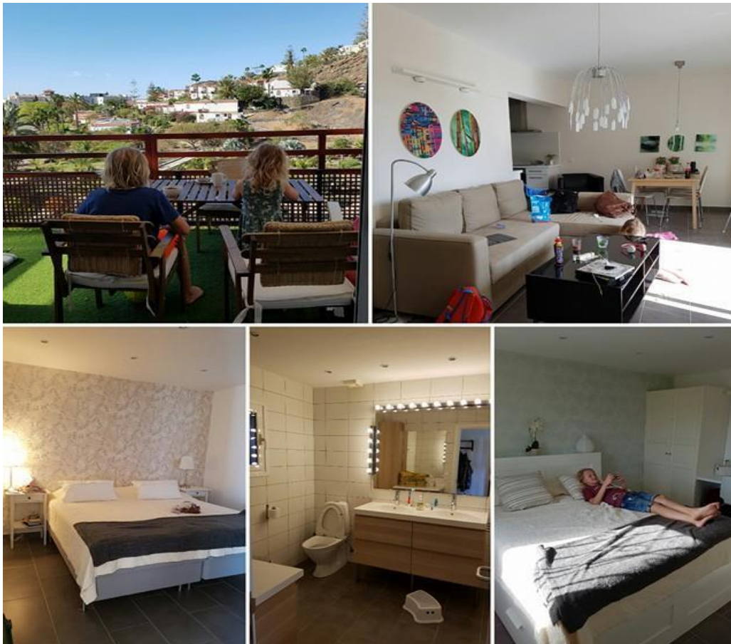
Vårt boende efter byte - Vi blev SÅ nöjda!

Vi anlände sent på kvällen och åkte med taxi till receptionen, och fick sedan skjuts av personalen till vårt nya hem. När vi öppnade dörren var besvikelsen enorm, det såg verkligen inte ut som på bilderna! I annonsen är lägenheterna oerhört fräscha, ljusa och moderna. Detta var ett sedan 70talet väl inrökt skyffe. Möblerna stod knappt upp, det var myror i hela köket och vitvarorna som utlovats lyste med sin frånvaro. Dagen efter pratade vi med personalen som lovade oss att få titta på två nya lägenheter, de var väldigt tillmötesgående. Lägenheten vi bytte till var rena drömmen, otroligt fint skick! Diskmaskin, tvättmaskin, allt du kan önska fanns fanns! Detta är då alltså lägenheter som de tar samma pris för oavsett skick, så ska ni boka där genom ska ni vara tydliga med vilken sorts standard ni önskar! Reser ni själva är det kanske okej med lägre standard, men reser ni med barn som ska behöva vara där under tiden du jobbar på skolan ska ni absolut vara mer kräsna. Visserligen var familjen mest ute vid poolen (området är fantastiskt med pooler, tennisplan osv), men det fanns ju dagar det regnade eller var för varmt att vara ute då vill man ju kunna vara i sitt boende.