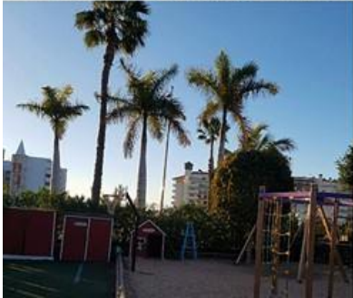
Förskolans lokaler + skolgården