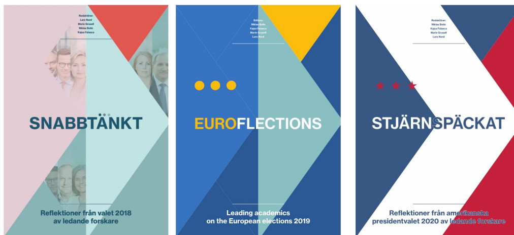
Figur 1: Projektgruppens tre rapporter