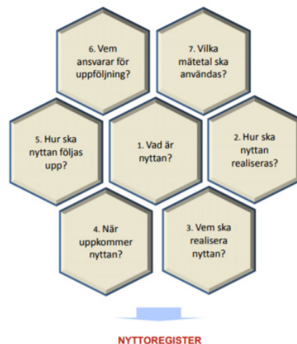
Figur 2-2 Sju frågor för att säkerställa nyttorealiseringen

Under arbetet med projektinitiativet och senare med projektplanen beräknas och dokumenteras bland annat de effekter och nyttor som projektet förväntas leda till i verksamheten.