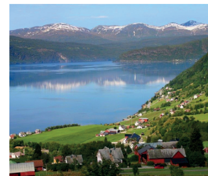
RESENS – Regional Utveckling och Samhällsentreprenörskap i Norge-Sverige

Samhällsentreprenörskapet är inte begränsat till någon särskild organisationstyp, sektor eller enskild bransch och finns på global, internationell, nationell, regional och lokal nivå.