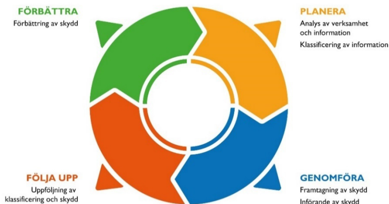
Figur 2: Modell för systematiskt arbetssätt med informationssäkerhet

Grundläggande för informationssäkerhetsarbetet är att det ska bedrivas systematiskt genom kontinuerlig uppföljning och förbättring, ofta beskrivet genom den s.k. PDCA-cykeln. Med PDCA-cykeln avses processen Plan-Do-Check-Act enligt ledningssystem för informationssäkerhet, SS-ISO/IEC 27001 (Planera – Genomföra – följa upp – Förbättra) samt aktiv dialog med ledning och verksamhet.