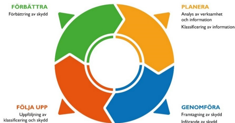
Figur 2: Modell för systematiskt arbetssätt med informationssäkerhet

Grundläggande för informationssäkerhetsarbetet är att det ska bedrivas systematiskt genom kontinuerlig uppföljning och förbättring, ofta beskrivet genom den s.k. PDCA-cykeln. Med PDCA-cykeln avses processen Plan-Do-Check-Act enligt ledningssystem för informationssäkerhet, SS-ISO/IEC 27001 (Planera – Genomföra – följa upp – Förbättra) samt aktiv dialog med ledning och verksamhet.